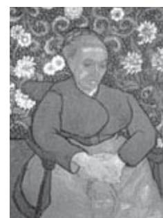
La Nana (Augustine Roulin, 1888/89)