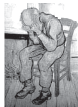
A las puertas de la eternidad