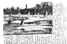
Cementerio (1883, carta 325)