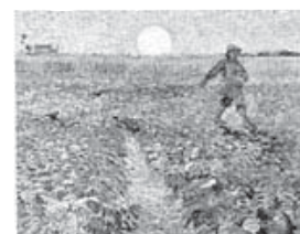
Sembrador con puesta de sol (1888)