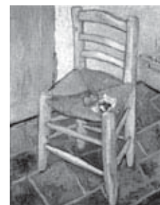
La silla de Vincent en Arlés (1888)