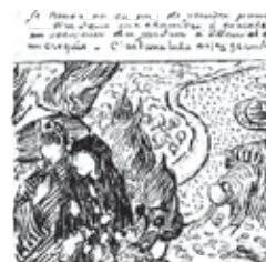
Boceto del Jardín de Etten, (1888)

“hacia finales de año iré una vez más a darte los buenos días. Dirás que lo he olvidado varias veces”.