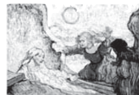
La Resurrección de Lázaro (1890)