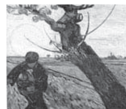
El Sembrador (1888)