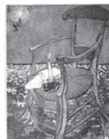
La silla de Gauguin (1888)