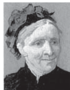
Retrato de la Madre de Vincent (Arlés 1888)