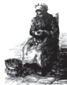
Mujer pelando patatas (1885)

Por último en Saint Rémy, cuando sepa del embarazo de Jo y conozca el nombre del niño que espera, El Segador sustituirá a El Sembrador . Siente quizá que es Jo quien ahora le burla la existencia, arrebatándole el nom-