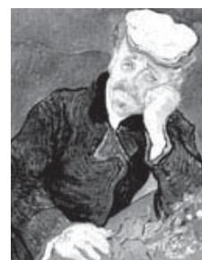
Retrato del Dr. Gachet (Auvers, 1890)