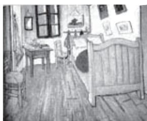
La Habitación en Arlés (1888)