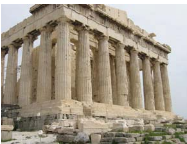
28 Sigmund FREUD: 1929: El malestar en la cultura , op. cit.