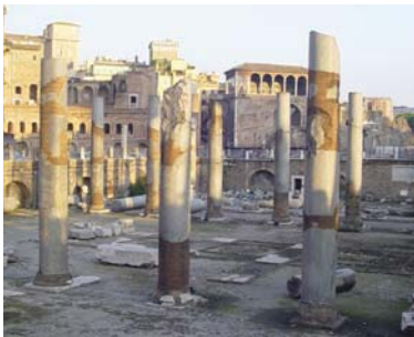
27 Sigmund FREUD: 1929: El malestar en la cultura , op. cit.