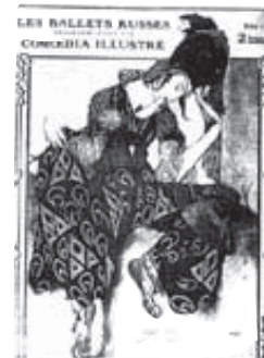
Programa de los Ballets Rusos, realizado en 1911 por Leon Bakst

En Petruchka se representaba la historia de un festivo carnaval ruso, en el que un muchacho tímido y frágil muestra su amor por una encantadora danzarina perseguida a su vez por un moro siniestro y poderoso. Petruchka y el moro luchan por su amor, y el segundo, infinitamente más fuerte, abate y destruye a