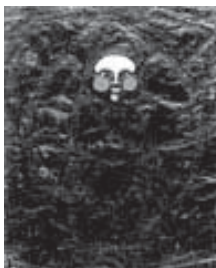
Vaslav Nijinsky. Máscara

El hermano mayor de Nijinsky, loco, muere. Él, ha contraído matrimonio con Rómola sin apenas conocerla, sin apenas poder comunicarse con ella. Una mujer en la que Nijinsky re-conoce a su propia madre, pues al igual que a ésta, Rusia –la tierra natal de Nijinsky– le da miedo.