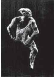
Auguste Rodin. Nijinsky , 1912