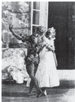
Tamara Karsavina y Nijinsky en El Espectro de la Rosa

su rival. La multitud y los agentes del orden rodean el cadáver de la víctima... pero cuando parecía imponerse la tragedia resulta que no ha ocurrido nada irremediable, ninguna desgracia, ningún crimen. Todo el mundo puede respirar tranquilo. Petruchka no era un ser humano... era una simple marioneta.