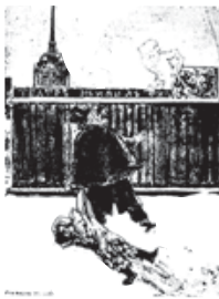
Cuadro de Alexandre Benois que representa una escena del ballet Petruchka