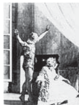
Tamara Karsavina y Nijinsky en El Espectro de la Rosa.