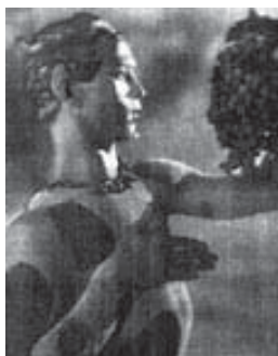
La Siesta de un Fauno. Documento fotográfico del Baron de Meyer

Contrariamente a lo que sucedía en La Siesta de un Fauno y en La Consagración de la Primavera , donde la impresión de violencia y aspereza de la expresión plástica se veía representada en el empleo –rebelde– de las líneas rectas y de los ángulos, se ve más tarde, en la época del aislamiento previo a la desestructuración psicótica, hacia 1917, arrasada por un sistema de notación que corresponde en su totalidad al círculo.