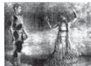
Nijinsky representando a El Fauno acercándose a la ninfa

Cómo señalábamos, la temática de las obras de Nijinsky da un giro radical tras la pérdida del padre. Nijinsky se casa, va a ser padre de una niña y poco a poco el aislamiento del mundo del ballet va siendo mayor. En los argumentos de 1917 ya no hay seducción, ya no hay flirteo, ahora una única mujer acapara el protagonismo final de la representación como consumación de la escena. En la descripción de estas nuevas secuencias coreográficas emergen contenidos con cierto matiz siniestro, pues ya no se hallan velados por la poética que caracterizaba la propuesta coreográfica de 1913. Quería mostrar, según palabras del propio Nijinsky, "a la vez la belleza y el poder destructivo del amor". Quizá las obras de juventud conservaban aún latente la huella de cierta búsqueda de identidad posible, mientras que en la madurez la identidad se encuentra avasallada.