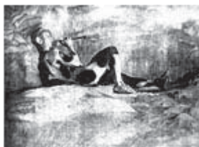
Nijinsky en La Siesta de un Fauno . Fotografía del Baron de Meyer

En el poema coreográfico El Espectro de la Rosa también interpretado magistralmente por Nijinsky, una muchacha, al volver de su primer baile, besa lentamente la rosa que un apuesto joven acaba de regalarle mientras cae dormida. De repente, el alma de la rosa surge a través de la ventana iluminada por la luna y de un solo brinco se sitúa detrás de la joven soñadora. Es un joven esbelto, asexual, etéreo y tierno personaje. Espléndido en su ligereza atraviesa el escenario de un solo salto. Súbitamente se detiene detrás de la joven y con un dulce beso le comunica lo inasequible, lo efímero de su amor. Después, sale por la ventana desapareciendo para siempre.