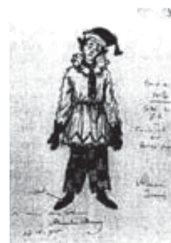
Alexandre Benois. Estudio del vestuario para Petruchka