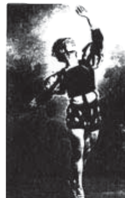
Nijinsky en Giselle , Acto II. Fotografía de Bert