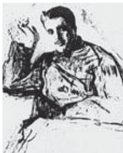
Valentin Serov. Retrato de Diaghilev, 1904

La carrera de Nijinsky, virtualmente, había terminado.