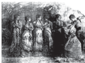
Nijinsky con Lydia Nelidova y otras cinco ninfas en La Siesta de un Fauno .

Un muchacho está dormitando en una tarde bochornosa y sofocante. Aparecen unas muchachas, y él pretende acariciarlas.