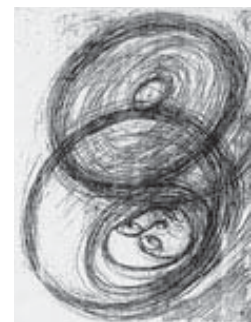
Dibujos circulares hechos por Nijinsky en Saint Motriz en 1918

El dramatismo interpretativo, el impulso de su propio talento creador, se hundía, ya en sus geniales comienzos, peligrosamente en la exigencia de una dinámica pulsional, que en un primer momento logra articular pero más tarde llegará a escindirle.