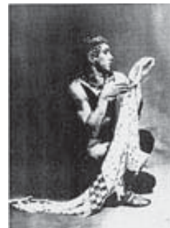
Nijinsky en La Siesta de un Fauno .

Pero la amistad de Nijinsky con Diaghilev era más que una amistad y éste, al recibir la noticia, escribió de inmediato un telegrama a Nijinsky comunicándole que no volviese, que el Ballet Ruso prescindía de sus servicios.