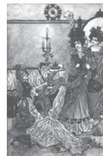
13 BETTELHEIM, Bruno: Psicoanálisis de los cuentos de hadas . Ed. Crítica. Barcelona. 1995. p. 247.