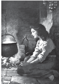
10 GRIMM, Jacob and Wilhelm: Kinder - und Hausmärchen . 1st ed (Berlin, 1812), Vol. 1, nº 21. Translate by A. L. Ashliman. Copyright. 1998.