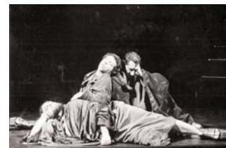
25 Isidoro MORENO, , Sevilla, 1992, pg. 29.

Finalmente este marco teórico explica por qué el poder artístico de los pasos de la Semana Santa de Valladolid tiene un efecto dramático decisivo. Ese poder es lo que hace creíble la obra externa, y por tanto que se consiga el efecto de teatro en el teatro . Es la credibilidad expresiva de los pasos lo que produce la tensión con el drama marco –la procesión–, y otorga de esa forma la autenticidad y la belleza única, la realidad del milagro dramático. En el caso de otras semanas santas, las esculturas son poco más que ninots –a veces menos– lo que se traduce en que a pesar de la entrega de las cofradías, la belleza de los marcos, la devoción de los fieles, etc. no se alcance ese efecto único que se consigue en las procesiones de Valladolid, en particular la del Viernes Santo. De nuevo una paradoja, la de que una Semana Santa carente de muchos de los ingredientes que dan su colorido irrepetible a las procesiones del Sur, carente de un marco urbano de la belleza del de Zamora o Cuenca, produzca un espectáculo de una intensidad dramática superior.