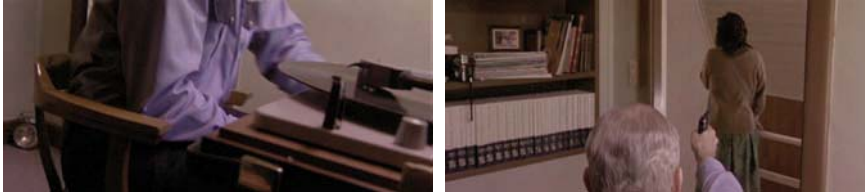
Bill: ¡Te estoy apuntando!

Y compartimos, en un plano semisubjetivo, su punto de vista.