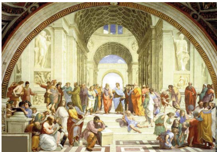
F1. La escuela de Atenas , de Rafael (1512). En el ámbito de lo gnoseología, Aristóteles rompe con la tradición socrático-platónica, inaugurando una división del saber que acabará conduciendo a la característica escisión moderna entre "ciencias" y "letras".

Ahora bien, en la metáfora que construye Sócrates en el Fedro el alma es un carro tirado por dos caballos, y junto al caballo noble que nos eleva