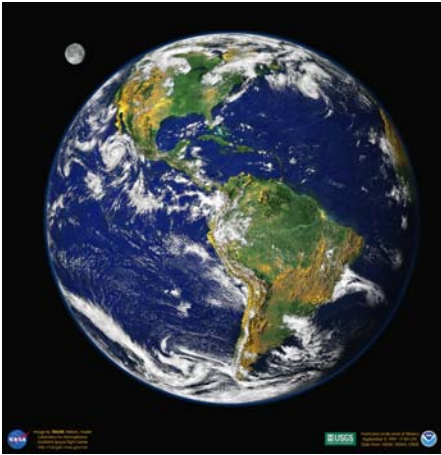
F13 Año 2000

Más recientemente, nuevas versiones en alta resolución realizadas desde satélites, se han incorporado a la colección.