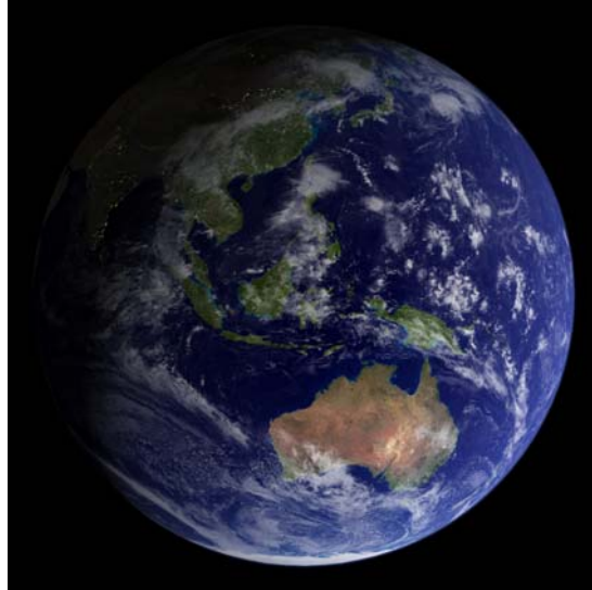
F14 Año 2002

La masiva difusión de la foto de “la canica azul” de 1972 contribuyó decisivamente a fomentar el activismo ambiental de la década de los 70. La imagen habla de vulnerabilidad, fragilidad, soledad de un planeta en algún rincón de un inmenso espacio oscuro.