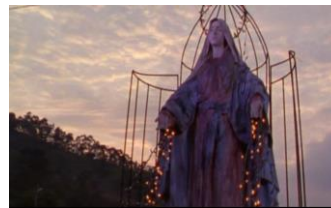
La vendedora de rosas (1998) de Víctor Gaviria

Así que después de la patada que El Zarco le ha propinado a Andrea al salir de su barrio, justo en el puente y justo al lado de esa virgen, Andrea le rinde tributo a esta, persignándose. Este acto resultará en un vacío leit motiv , ya que la presencia de esa virgen en mitad del puente que separa esos dos territorios igual de violentos, figura estática que une dos infiernos, no será suficiente para calmar las ansias de muerte y de violencia de sus habitantes: una vez más, escultura de yeso, material inerte que no servirá de nada. ii