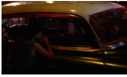
La vendedora de rosas (1998) de Víctor Gaviria