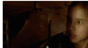
La vendedora de rosas (1998) de Víctor Gaviria

A la vez el niño habrá hecho un aprendizaje terrible, observando claramente la presencia de esa muerte: