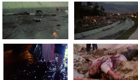
La vendedora de rosas (1998) de Víctor Gaviria

fuego estando presentes de principio a fin. Asisten allí como elementos sucios y mortíferos, pero a la vez como símbolos de la purificación y de la renovación. La película se abre y se cierra, pues, con la presencia del agua: amenazante, sucia, maloliente, una cloaca que es la metáfora de la situación que se vive en la ciudad. De hecho, es allí donde el Zarco encontrará la muerte, como si estuviera a punto de ser arrastrado por el agua, como tantas veces sucedió en la Violencia Bipartidista con miles de muertos río abajo, y como sigue sucediendo ahora, así muchos lo quieran obviar. Agua pues que abre y cierra el relato y que funciona como cloaca y muerte, pero a la vez como nacimiento y regeneración.