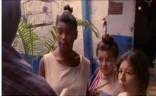
La vendedora de rosas (1998) de Víctor Gaviria

El padre explica las razones, está decidido, es tal vez una de las figuras más positivas y serenas del relato: