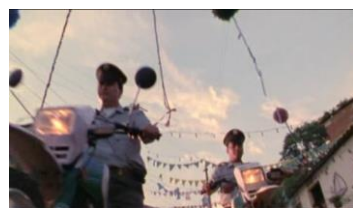
La vendedora de rosas (1998) de Víctor Gaviria

Esa autoridad inútil, también toma la forma de la vigilancia privada, pero esta vez en la forma más autoritaria posible: