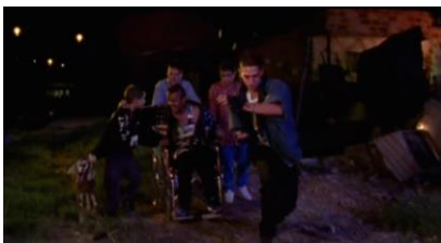
La vendedora de rosas (1998) de Víctor Gaviria

También Don Héctor funciona como padre de la horda criminal: él manda y cuida; a él lo cuidan también y empujan en su silla de ruedas: