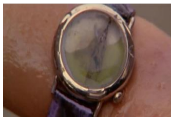
La vendedora de rosas (1998) de Víctor Gaviria

Así que aparte de funcionar como un actante fundamental, también sirve como puesta en abismo, reflejando especularmente ciertos elementos del relato. Ya que la primera vez que vemos el reloj de Mónica, en un close-up extremo, observaremos allí a una niña, a una especie de Mónica, y que parece feliz a punto tal vez de montarse en una bicicleta.