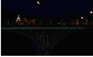
La vendedora de rosas (1998) de Víctor Gaviria

Una vez Andrea atraviesa el puente, observaremos que igualmente en La Setenta dominarán los vendedores de drogas -bandas de casi niños que no parecen tener ninguna otra opción-, vendiendo drogas que es el reverso de la venta de rosas, formas adicionales en el intercambio económico que se manifiesta en la película. Y particularmente esas rosas vendrán a reforzar la iconografía mariana tan presente en la película porque estas son el símbolo de la virgen María: