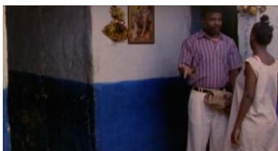
La vendedora de rosas (1998) de Víctor Gaviria

Así que Diana parte con él, con seguridad para hallar un mejor futuro, en un ambiente que con seguridad va a ser mejor que el que deja atrás.