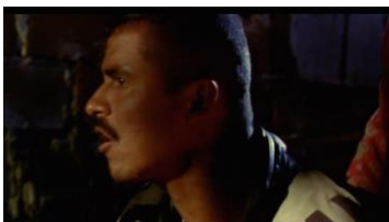
La vendedora de rosas (1998) de Víctor Gaviria

Si hay algo que define a Mónica es la alucinación y la muerte, escenificadas durante la noche, con una presencia constante y amenazante de la luna, como si esto fuera un cuento de terror gótico. Cada que hay una muerte, aparece la luna anunciando un desequilibrio escabroso, pero a la vez también una renovación. La primera muerte que observamos en la película (la de Mónica será la última) se da cuando de la nada y porque sí, matan a un habitante de La Iguañá, y El Zarco roba su reloj. Una muerte gratuita que solo es una molestia y que impide que el carnaval navideño siga teniendo lugar. Ello es claramente expresado por Don Héctor, el líder de la banda: “Esta gonorrea nos dañó el 24 hom'e, gonorrea hom'e” (Gaviria 1998)