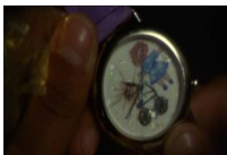
La vendedora de rosas (1998) de Víctor Gaviria

Así que aparte de funcionar como un actante fundamental, también sirve como puesta en abismo, reflejando especularmente ciertos elementos del relato. Ya que la primera vez que vemos el reloj de Mónica, en un close-up extremo, observaremos allí a una niña, a una especie de Mónica, y que parece feliz a punto tal vez de montarse en una bicicleta.