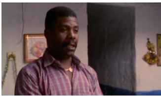
La vendedora de rosas (1998) de Víctor Gaviria

El padre explica las razones, está decidido, es tal vez una de las figuras más positivas y serenas del relato: