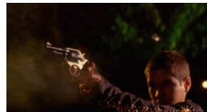
La vendedora de rosas (1998) de Víctor Gaviria

Hacia el final de la película, este mismo niño intentará dar muerte al Zarco, habiendo aprendido muy bien esa lección, en un asfixiante eterno retorno: