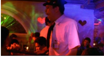
La vendedora de rosas (1998) de Víctor Gaviria

Mónica, pues, debe sobrevivir en este duro mundo. Y si a través de Andrea se nos ha ofrecido una mala imagen de la madre, con Mónica esta será incluso inexistente. Lo único que puede hacer es reemplazar esa ausencia con el recuerdo de su abuela ya fallecida, reemplazándola en sus alucinaciones con una figura de yeso. En este mundo salvaje, Mónica también conocerá el amor por primera vez, acogerá a Andrea solidariamente, así que se puede decir que la historia gira en torno a las dos. Mónica recurrirá a las drogas para escapar de este mundo y tal vez para, inconscientemente, encontrarse de nuevo con su amada abuela. Mónica será la que tenga la mala suerte de caer en las garras de la delincuencia. Muere, eso sí, feliz buscando con anhelo los brazos de su recordada abuela. Pero Mónica solo tendrá ese reencuentro con el ansiado amor de familia en la forma de la alucinación. Tal vez lo único que pueda estar disponible para ella en ese momento.