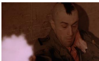
Taxi Driver (1976) de Martin Scorsese