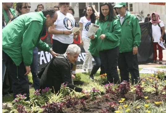
Imagen 3: Inauguración del jardín de la Siempreviva. Febrero 28 de 2013.

El jardín de la siempreviva es un lenguaje, un espacio para la vida y una forma de decir que estamos dispuestas a construir una historia nueva. En sintonía con Maathai Wangari, Premio Nobel de Paz en 2004, las mujeres que hemos sembrado y cuidado el jardín sabemos que “estamos llamadas a atender la tierra para curar sus heridas y en ese proceso, curar las nuestras propias” ya que la sentimos parte de nuestra identidad, de nuestra cultura, tal como ella afirmó “la restauración de la integridad de la tierra y las mujeres, van de la mano” 11 . En el jardín hemos “abrazado la creación entera, en toda su diversidad, belleza y maravilla”