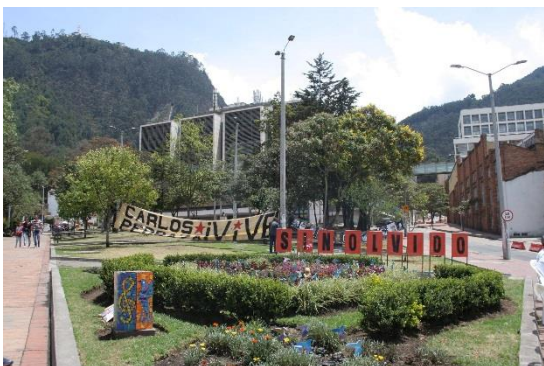
Imagen 4. Jardín de la siempreviva. Febrero de 2016. Bogotá D.C.

Frente a la violencia patriarcal de nuestra cultura, espacios de sanación y resiliencia como el jardín de la siempreviva, nos dan una opción de diálogo, supervivencia y transmutación. En ese sentido Cristhiane Northrup ha sugerido trabajar opciones en las que se circunscribe el feminismo como una experiencia basada en “las antiquísimas culturas y filosofías marginales basadas en valores que el patriarcado ha etiquetado de “femeninos”, pero que son necesarios para toda la humanidad . Entre los principios y valores del feminismo que más se diferencian de los del patriarcado están la igualdad universal, la solución no violenta de los problemas y la colaboración con la naturaleza, entre nosotros y con las demás especies” 12