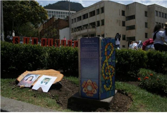
Imagen 1. Jardín de la Siempreviva, Bogotá D.C., 2016