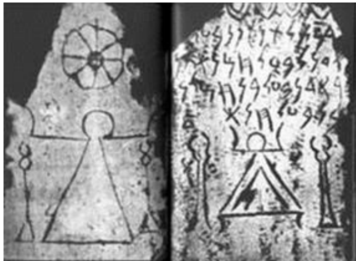
Chaxiraxiue, deidad venerada en Tenerife que representaba a Canopo y a la Madre antes de la aparición de La Candelaria.