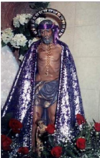
San Lázaro cubano