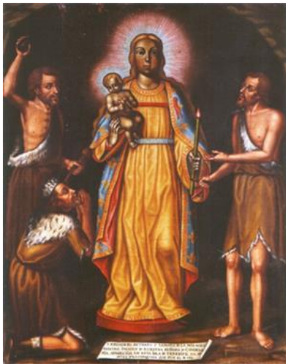
Alegoría a la aparición de la virgen La Candelaria en Tenerife, según la descripción de los frailes.

A manera de resumen, la simbología de la Candelaria devoró el inicio de año para los guanches, 5 a la simbología católica que hace referencia a la presentación del Jesús cuarenta días después de nacido (Éxodo 13, 11-13); también al discurso de Simeón donde reconoció a Jesús como: “salvador y luz para las naciones y gloria de Israel”; a la “procesión con candelas” que aún en el siglo X se realizaba el 15 de febrero para recordar que la virgen dio luz a Jesucristo (y no al contrario), se cambió la fecha al 2 de febrero, cuarenta días posteriores a la Navidad, para que coincidiera con la purificación de María, no obstante, en 1929 el Concilio Vaticano II determinó que esa fiesta del 2 de febrero es estrictamente de orden cristológico, y se celebra rememorando la presentación de Jesús en el templo, y no por la purificación de María. Lo cierto es que en el mundo católico externo a los documentos, la fiesta es la “Fiesta de la Candelaria”, de modo que el carácter cristológico no es otra cosa que una coreografía del festín.