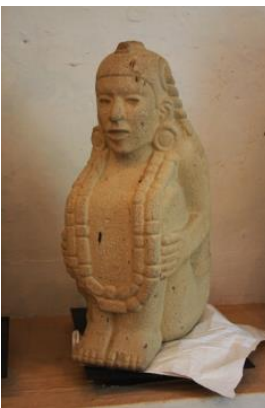
Chalchihuitlicue, deidad predominante en el norte de Veracruz, señora del agua, los ríos, mares, tormentas, truenos, nacimientos y bautismos.