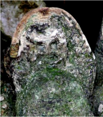
Diosa Atabeira esculpida por los primeros habitantes de Cuba.