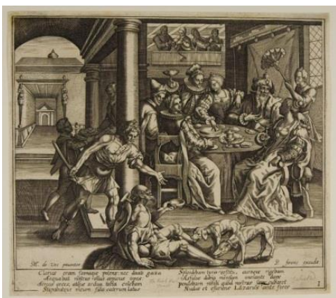
Lázaro el mendigo