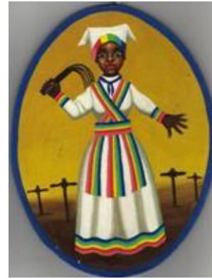
Oyá es la divinidad de la muerte. Propicia temporales, vientos fuertes o huracanados y las centellas. En la naturaleza está simbolizado por la centella.