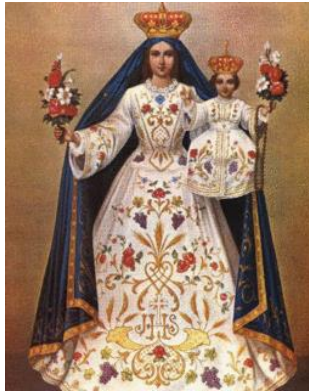
La Candelaria Universal