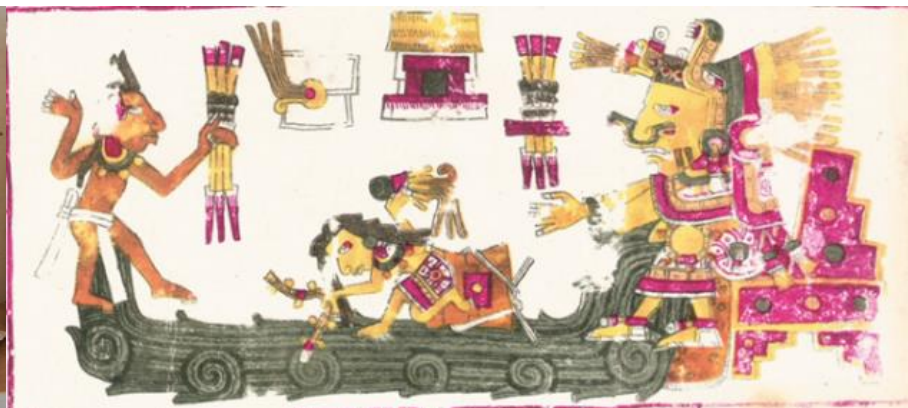
Chalchiuhtlicue in Codex Borgia.