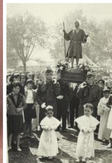
San Lázaro Oviedo